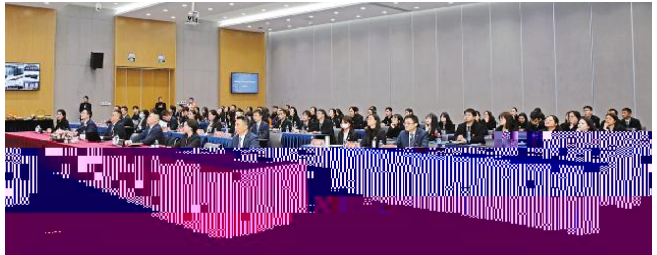
通威太阳能人行法体系 2023 年度述职会现场

V s! hi Yj &kI mn( opq - rstuV& 2024T>vwxy V&' s=z(o{ | U; tu: }~p& : &V |l ' & g^;<( f&" 2023 (!tu s & ( ] ^ = GEf@5 & } (U; tu: j ' f( U^(b + (q- _ST v' ( ] Q s xFc 42 (*I J* RU ' ( dtU . Sot uvwxQI g 200GW( l 6 g U ' otuQI P ^ +aZ _ j J** | ( } 40 7 ^ . (U D Y s' - o R_ J K + ' ; ; .5a& % +G` 3.8GW(5V J K& tHI T v' (tu _RL+ss . (4D+ / q{ ( ' .& s { S(a5@5 + 9 & 5( L 86>s& ( tu (2. @5 "HI _Sot u U< * @ 5@A(