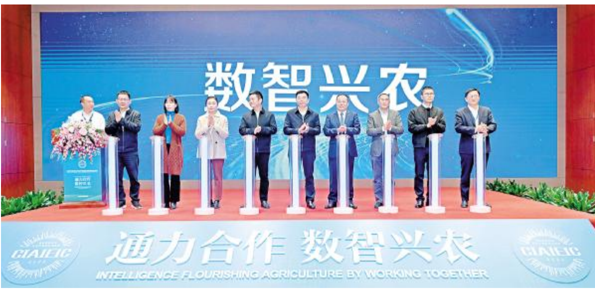
国家智慧农业行业产教融合共同体正式成立

● 在共同体未来发展中,理事长单位会当好政府决策“助手”、当好行业发展“推手”、当好企业壮大“帮手”,牢记职责使命、认真履职尽责,和全体成员单位一起做好共同体的建设工作。