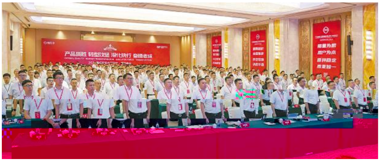
2023 通威农发水产科技·营销年会华南站会议现场

参 并作重要指示 相关部门负责人 各 负责人 与 众 记者 唐小燕 通讯员 张子颜 马光超