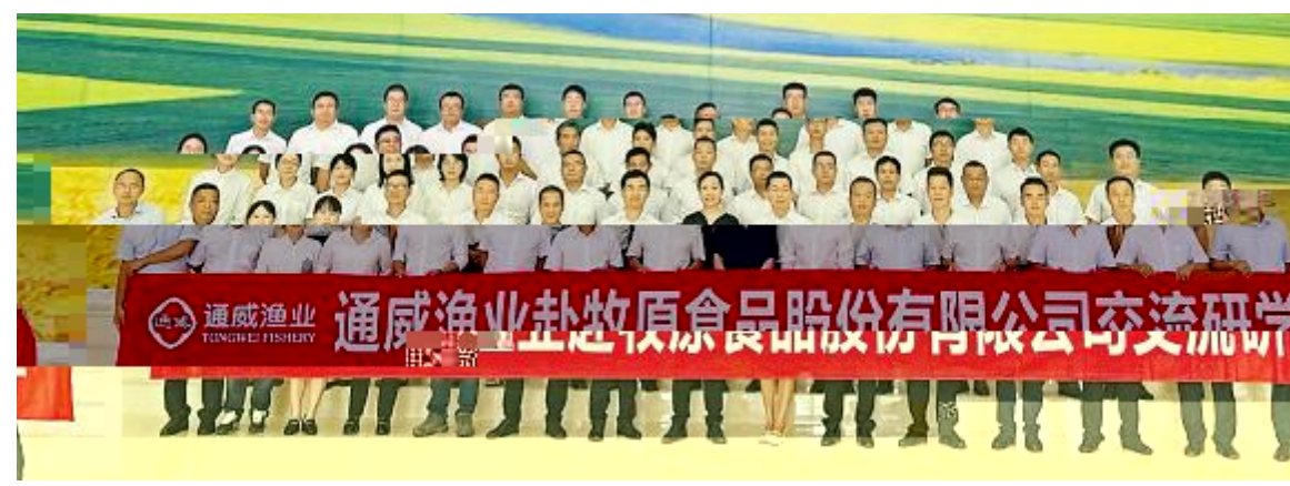
通威农发赴南阳牧原股份开展交流研学

同了通作控,牧原、广农、广东壹、品等业分享了在团队建设、作、管控等方面的经。海南饲料业总经理海南生物动交流,同行业的发展势与应。海南生物总经理联分了海南料场行、发、原料上等,行业发、原料上加,海南同了大的与。行业与合,海南场,保有发展,我以合作的发展理,行业业、对,海南饲料行业加质量发展,为海南的养殖业加。