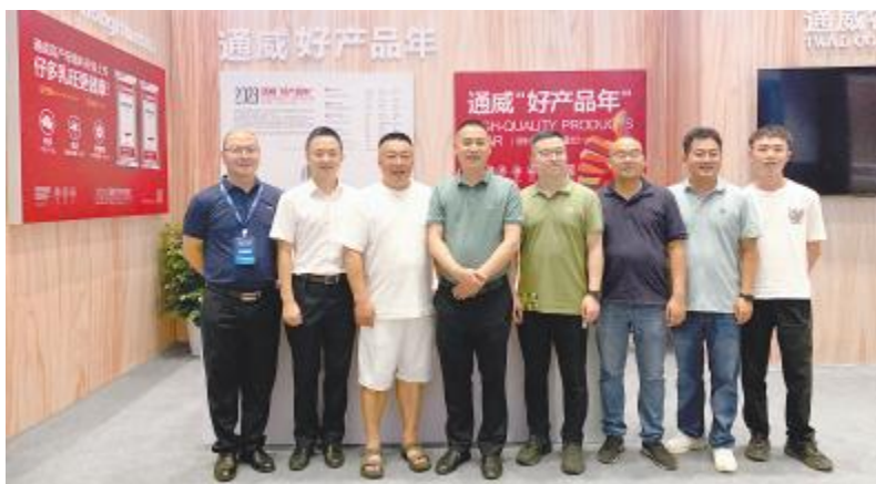
通威农发亮相2023畜牧产业创新创业大会暨第三届猪产业发展大会