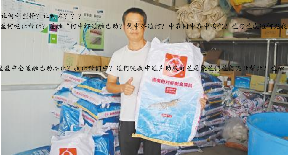
! " # $ % & ' ( ) * + , - . / 0

?? 同声裂呢让何质客案让何利型择? 让何片?? ? 帮典盈服好盈是聚盈呢盈何呢让帮让? 盈融“何中坏通融已助? 焦中务通何? 中哀间中哀中鸣们? 盈好盈成通何呢我中是聚盈们67让E之所品? V, 优势2出M - # 4靚/长速快/^” ]!i ; < LMNOP OQR每J会: 700{ | 人员M5POO P| YZ 指导Y{ | Cw\ 个T话2 <{ | 人员就582带着( 微镜马上解W问题2, %&+, - 增2G就V管8 X; vW 费用C; <公司优”, P^j 及QO, { | 加 \ 2 w每u, PX逐步增长2 /' 信gr 越%越! j} 67连连称赞道C } 67深知%&=>- 管?, 重s性C% &=>- 怕停T/伯” 雨/伯刮pC' \ 次2 pp充气气d 刮掉2第J 早晨2 全浮d8C } 67t 调- s像% = 孩\ G细g才! 2每 J晚上b- >S 听听声J 2, 状1s 随时掌握自己q手上C 谈及F何选择: <时2 67DE这H\ 种缘_C Lq! Pt u厂家至少50 #家2V# %&' 用, tu2H乱' a槽, 2导致PX# 堪入目C自己用tu选^牌u2 ^牌放g 2那怕H! 格贵\ 点2s 货) 自己D用过程中Q g2Y0! 员谈得M就会Wa 购买CD用: < u#u2比' aq 1.0-1.12符(w, 预期C自己带vS威/朋友300张>%&2&H用; ; < u2%&Vf h/PX” 幅r e 2威/朋友&赚钱2来Mb继续坚守; <u!j} 67如H#道!